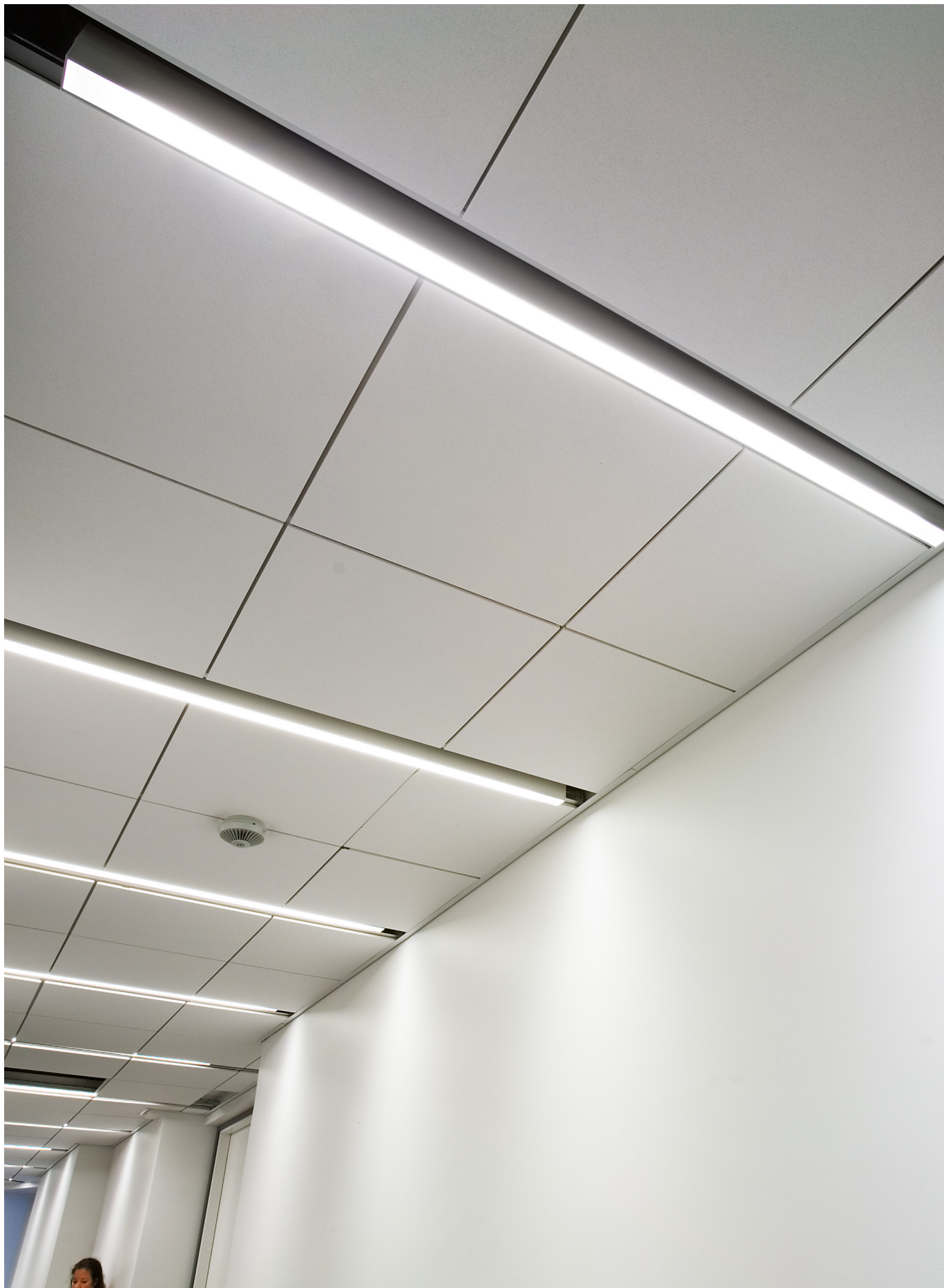
Korridor Group M, Stockholm. (Lösning med T5)